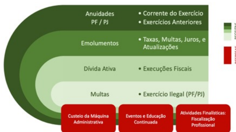
Figura 02 – Modelo de Negócios: